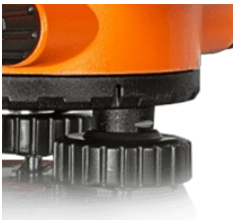
Плавный ход винтов при любой температуре