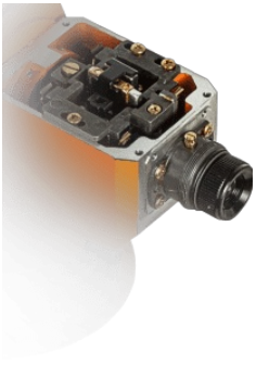
Надежный магнитный компенсатор