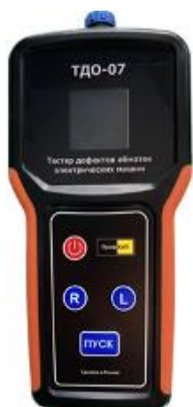
Рисунок 1 – Общий вид приборов ПрофКиП ТДО-07