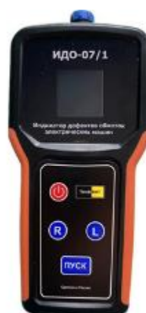
Рисунок 6 – Общий вид приборов ПрофКиП ИДО-07/1