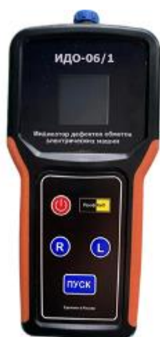
Рисунок 5 – Общий вид приборов ПрофКиП ИДО-06/1