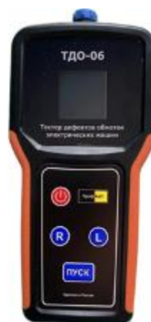
Рисунок 2 – Общий вид приборов ПрофКиП ТДО-06