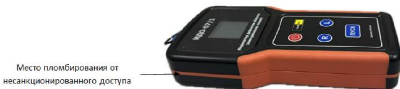
Рисунок 8 – Схема пломбирования от несанкционированного доступа