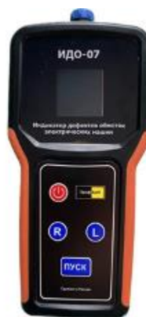
Рисунок 4 – Общий вид приборов ПрофКиП ИДО-07