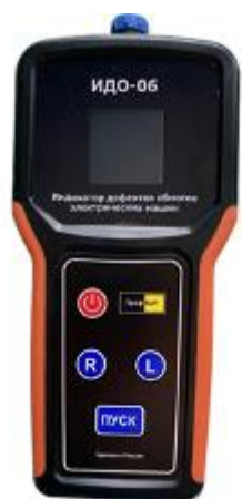
Рисунок 3 – Общий вид приборов ПрофКиП ИДО-06