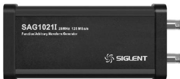
Программно-аппаратная опция внешнего модуля функционального генератора (SAG1021I).