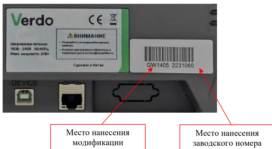
Рисунок 4 – Фрагмент задней панели генераторов с этикеткой