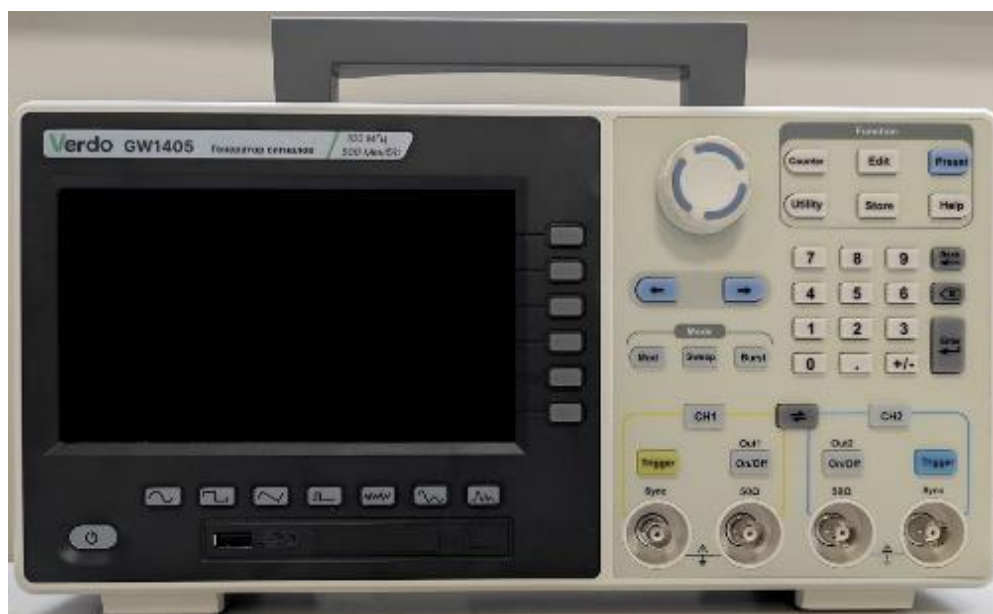
Рисунок 1 – Общий вид (передняя панель) генераторов GW1401 – GW1405

Места для нанесения знака утверждения типа и знака поверки, а также схема пломбирования указаны на рисунке 3.