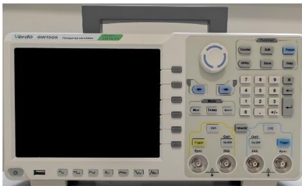
Рисунок 2 – Общий вид (передняя панель) генераторов GW1501 – GW1505