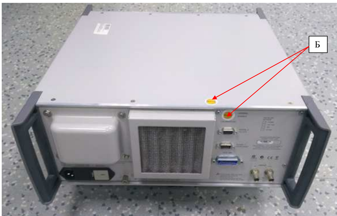
Рис. 2 – Схема пломбировки от несанкционированного доступа (Б)